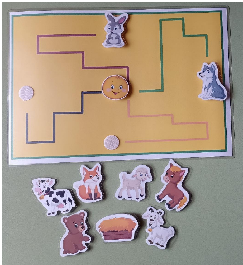
«Гимнастика для глаз»